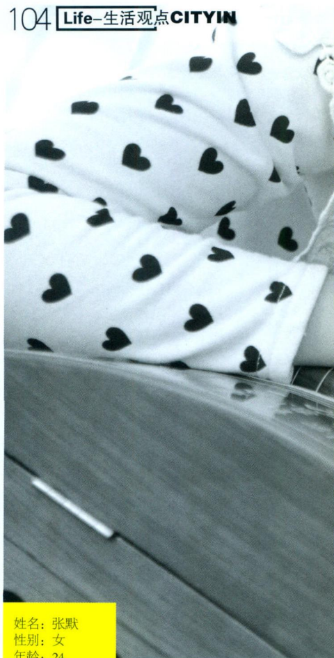
姓名：张默 性别：女 年龄：24 职业：客户经理