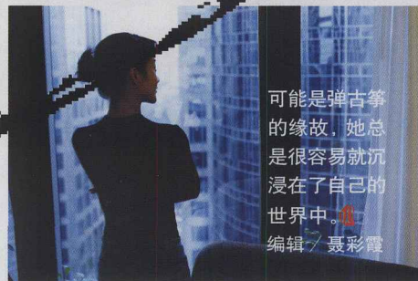
可能是弹古筝的缘故，她总是很容易就沉浸在了自己的世界中。 编辑 / 聂彩霞