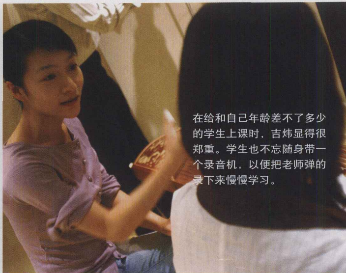
在给和自己年龄差不多了的学生上课时，吉炜显得很郑重。学生也不忘随身带一个录音机，以便把老师弹的录下来慢慢学习。