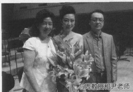
与周教授和尹老师