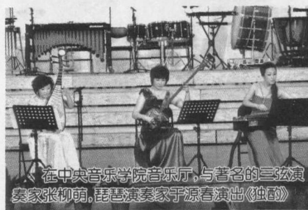
在中央音乐学院音乐厅，与著名的三弦演奏家张仰萌、琵琶演奏家于源春演出《独酌》