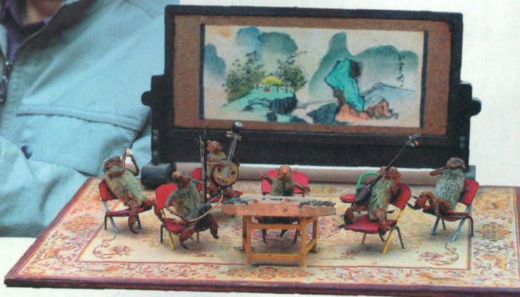
▲小毛猴各司其职，一场生动的演奏会上演了。

扬琴、三弦、琵琶、二胡、笛子、古筝，一场演奏会的乐器一应俱全，却都不超过手掌大小。