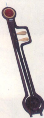
▲微型板胡，整体长度不如一根手指头。

孙振洪的缩型创作并不只有乐器，在2008年奥运会期间，他就按1:400的比例缩小复制了近百件精巧的奥运设施，但孙振洪最钟爱的还是这些微型乐器。他最大的愿望就是开一个微型乐器博物馆，让更多的人了解乐器，了解乐器背后的故事。用民间工艺弘扬民族文化，这是老孙执著的信念。