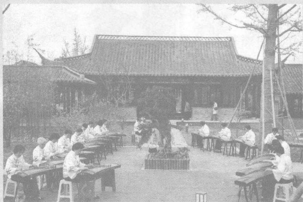
扬州老年大学古筝队在康山园为扬州市2006年烟花三月经贸旅游节来宾演奏。

上午9点半，吴邦国委员长来到了我们古筝班，看着学员们整齐而富有感情的弹奏，委员长非常高兴，随即与正在弹奏的学员亲切的交谈起来：“你古筝学了多久了？一星期上几节课啊？”言谈之间，关心百姓的情怀溢于言表，委员长的亲民作风感染了在场的每一个人。接着，委员长又特地把我叫到他的身边，握着我的手，和我聊起来：“你来老年大学教学多久了？”“我是扬州大学艺术学院四年级的学生，来这教课一年多了。”“哦，还是大学本科生，那你的这些老年学员学奏一首曲子需要多长时间？”“一般一些初级古筝曲，我们学员在第一学期就能掌握了。”“哦，那你们古筝班使用的什么教材啊？”“选择了一些简单易学的小曲子，其中不少还是根据大家耳熟能详的民歌改编的。今天我们弹奏的是扬州民歌《茉莉花》。”“哦，那很好啊。你的这些学生都可以做你的叔叔阿姨了，甚至可以当爷爷奶奶了，呵呵。”委员长的一番话激起了大家一片欢笑。这充分体现了委员长对老年教育事业的关心和重视，顿觉肩上有一种光荣的使命感压下来。今后，我将继续努力，为老年教育事业献上自己的一份力量。■