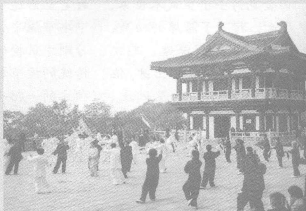
扬州老年大学拳剑班学员在大明寺参加庆祝2006年敬老日活动。